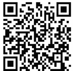
「海口公安交警」二维码