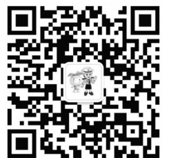
「椰城交警」微信二维码

扫码添加椰城交警微信公众号和海口公安交警APP,既可了解海口公安交警最新资讯动态,还可享受更多便民服务。