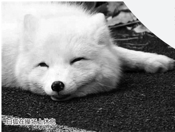
白狐在操场上休息