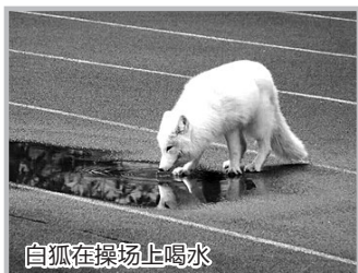
白狐在操场上喝水

昨天,有网友发微博:杭州萧山十一中的校园内和附近街头发现了一只“狐狸”!图片中那只狐狸通体雪白,很多网友把它与前段时间热播的电视剧《三生三世十里桃花》联系了起来。网友“@Candy鹭葶”说:“这是浅浅到凡间来找夜华吗?”