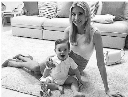
伊万卡在社交媒体上晒出与儿子的照片，照片中的积木被网友认为是“中文益智玩具”