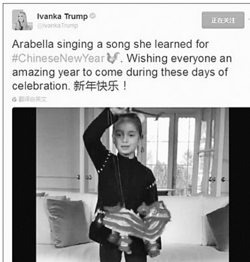
今年初，特朗普女儿伊万卡在社交媒体上晒出女儿唱《新年好》的视频