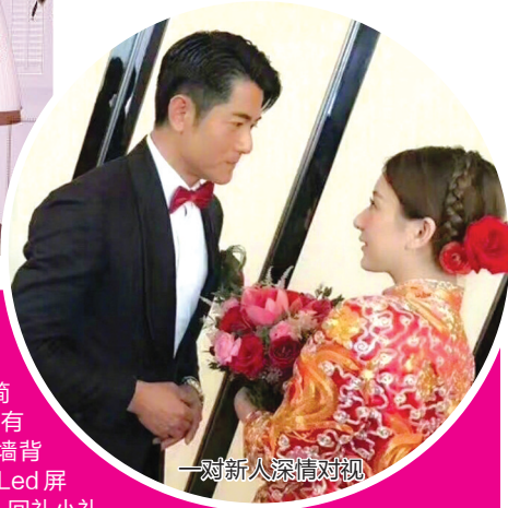
一对新人深情对视

昨日,51岁的郭富城正式迎娶29岁的女友方媛,并在香港举行婚宴。郭富城婚事非常低调,保密工作到家,因此消息直到昨日上午才曝出。昨日傍晚,郭富城的经纪人小美向媒体发布郭富城的新郎照。照片中郭富城一身深蓝西装配红色领结,胸口别着红花,很是喜庆。另一张照片则是郭富城与张智霖等一众好友组成的伴郎团合影。