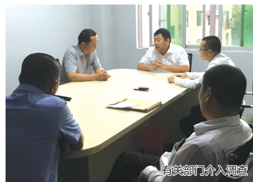
有关部门介入调查

记者在该公司办公室看到一张4月11日海口市住建局的公告,上面写着:“阿里山公司:根据群众举报你公司代理的日出阿里山项目涉嫌违规销售,经查该项目未取得商品房预售许可证,不符合商品房预售条件,