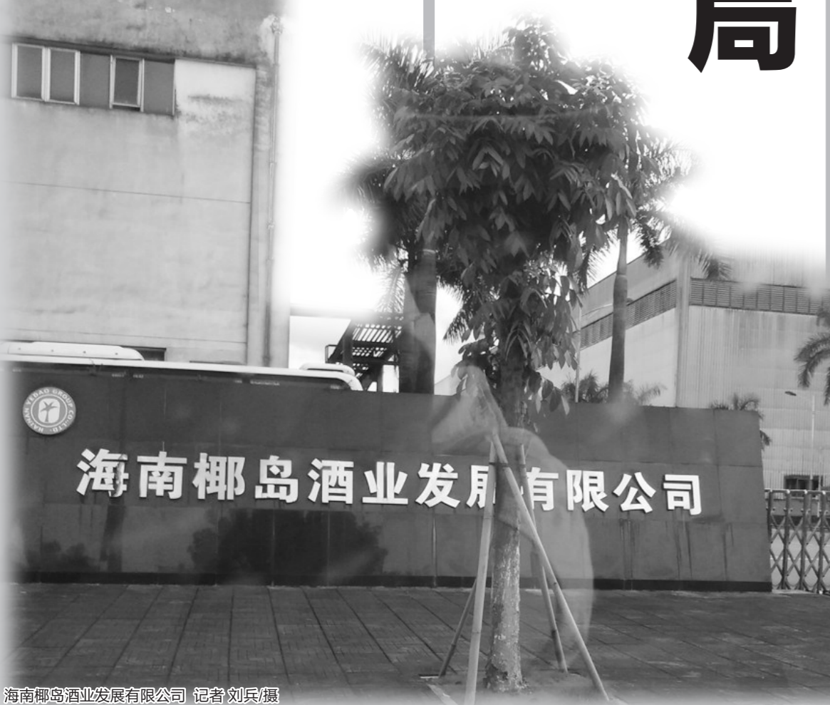
海南椰岛酒业发展有限公司