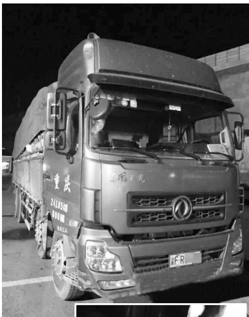
▲小伙“约”到的大货车

针对大货车是否涉嫌非法营运、超速、疲劳驾驶等,相关执法部门表示,将会做进一步调查。 重晚