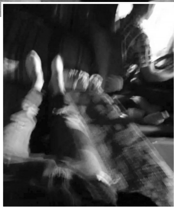
▶大货车驾驶室里还有床,可以睡觉