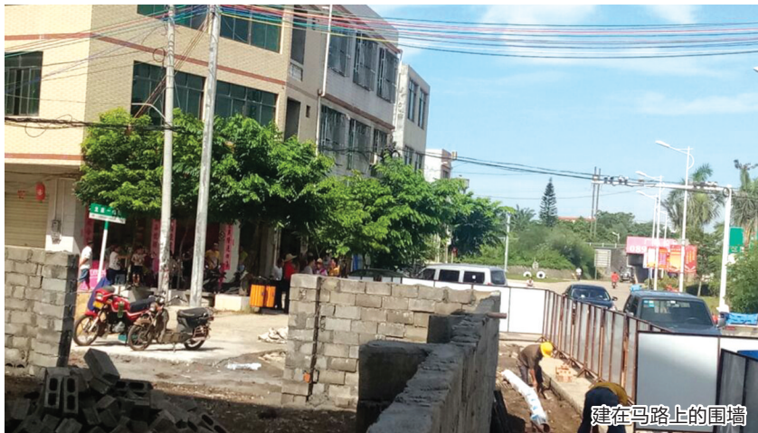
建在马路上的围墙