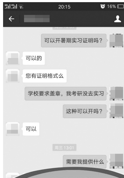
记者与客服的聊天内容截图

此外,记者在淘宝网上搜索发现,“实习证明”还可以“私人订制”,买家想要什么样的证明和印章,卖家都能满足。记者咨询一家店铺的客服了解到,刻一枚普通公司的印章需要50元,买家只需将公司名称告知店家即可。