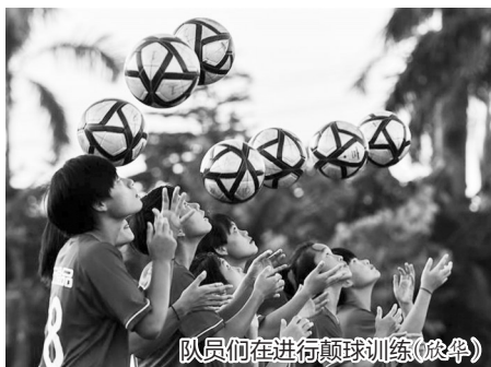
队员们在进行颠球训练(沈华)