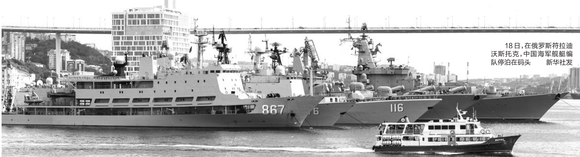
18日,在俄罗斯符拉迪沃斯托克,中国海军舰艇编队停泊在码头 新华社发

新华社电 随着中方舰艇编队18日依次驶入俄罗斯符拉迪沃斯托克军港,中俄“海上联合-2017”第二阶段演习兵力集结完毕,演习正式开始。