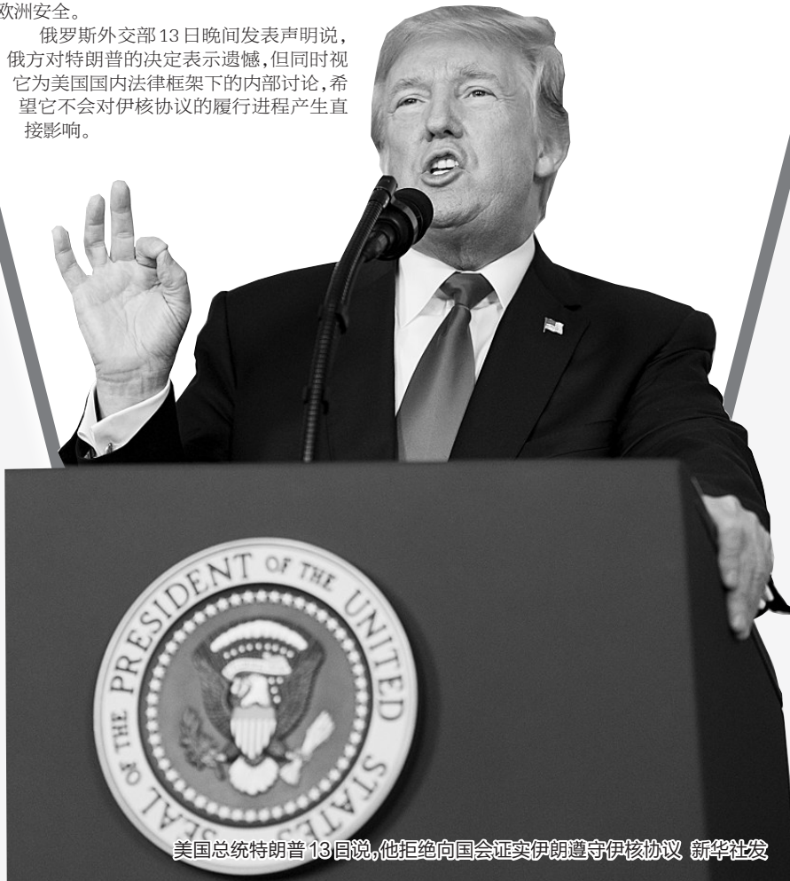
美国总统特朗普13日说,他拒绝向国会证实伊朗遵守伊核协议

据英媒报道,在阿联酋迪拜,警察开豪车执行任务已经是一大特色了。不过最近迪拜警察即将借助一种新的交通工具“飞行摩托”来完成执勤任务。报道称,这款飞行摩托由俄罗斯一家公司研制,可以飞行到距离地面五米高的地方。最高时速可以达到70公里。最长可以在空中飞行25分钟。它是电动四旋翼飞行器,它将无人机和摩托结合。该摩托车可以携带一名警察,也可以远程操控。在发生紧急情况,交通拥堵的时候,警察就可以开着飞行摩托快速高效地巡逻了。 法晚