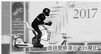
迪拜警察演示飞行摩托

他在声明中说:“在三星电子内外遭遇空前危机时,我认为现在是公司重新出发的时候,重整精气神并配备更年轻领导层,以更好应对IT行业日新月异带来的挑战。” 北晚