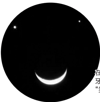
双星 在上、月 牙在下的 “笑脸图”

17日到18日清晨,美丽的“双星伴月”将出现在东方的低空。如果天气晴朗,金星、火星与一轮残月相依相伴的美好图景将在日出前上演。