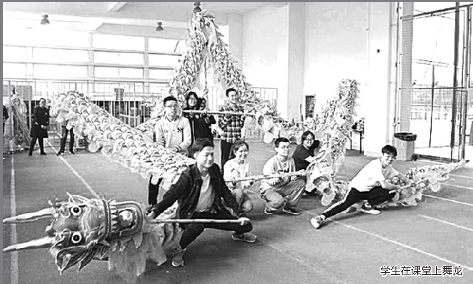
学生在课堂上舞龙

每逢佳节,各地都少不了这样的场景:十多位身形壮硕的汉子身着红色或黄色套服,手举木棍,头顶巨龙,跟随“龙珠”来回游走,扭、挥、仰、跪、跳、摆,摆出各种造型。一旁的观众连连叫好,掌声雷动,祈愿来年风调雨顺,人寿年丰。