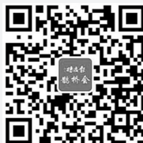
鹊桥会微信二维码

今年,活动形式延续往届的互动性,现场资料墙展示,还将在现场为嘉宾设置专门的展示区、上台集体亮相以及分区互动等多个活动环节。