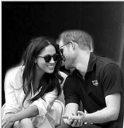
今年9月,在多伦多举行的“不可战胜”运动会上,哈里与马克尔首次以情侣身份公开露面

据新华社电 英国王室27日宣布,现年33岁的哈里王子本月早些时候已在伦敦与美国演员梅根·马克尔订婚。两人预计明年春天举行婚礼。