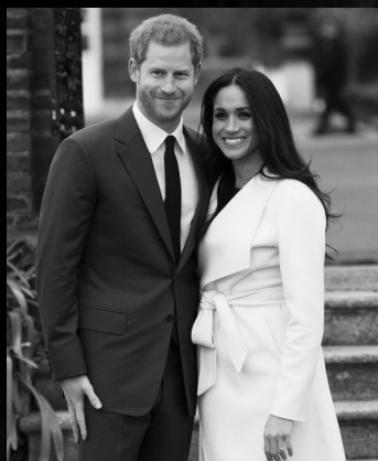
11月27日,在英国伦敦肯辛顿宫,哈里王子(左)与梅根·马克尔接受拍照

“我自己上街买东西,有时候我也担心有人用手机拍我。但我下定决心要过一种相对正常的生活。如果我运气够好能有孩子,我决心让他们也能有比较正常的生活。”