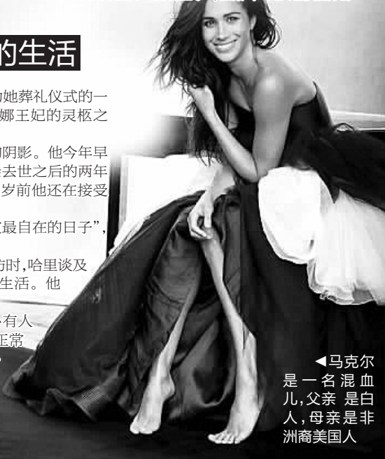
马克尔是一名混血儿,父亲是白人,母亲是非洲裔美国人