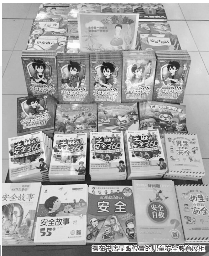
摆在书店显眼位置的儿童安全教育展柜