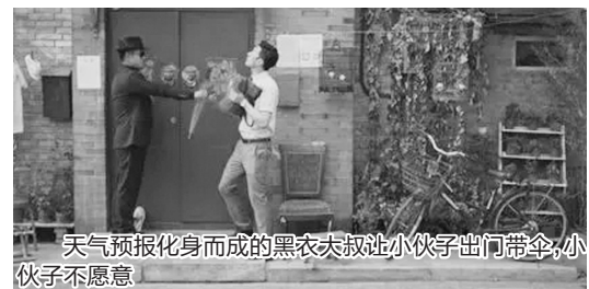
天气预报化身而成的黑衣大叔让小伙子出门带伞,小伙子不愿意