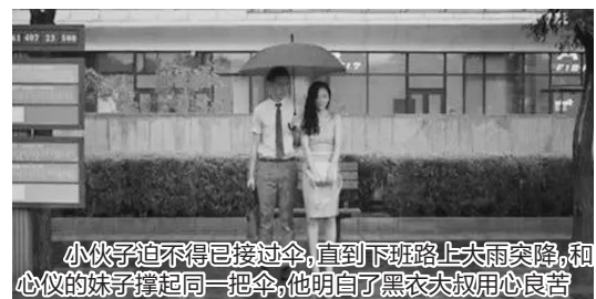
小伙子迫不得已接过伞,直到下班路上大雨突降,和心仪的妹子撑起同一把伞,他明白了黑衣大叔用心良苦

你有没有想过,每天都看的天气预报,如果变成人,他长啥样儿?最近,还真有人帮咱实现了这个想象,它不是别人,正是中国气象频道本尊。在2018年的第一个礼拜,中国气象频道推出了两部宣传片。向来正襟危坐、一本正经进行天气播报的气象频道,这次着实让人大吃一惊。网友直呼,“专心拍宣传片不好么!播什么天气预报!”