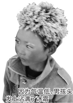
因为气温低,男孩头上沾满了冰霜

据其称,“我下去的时候,看到车还没有开,车门是开着的。我觉得动车在一个站就停10分钟,我还剩2分钟,我为什么就不能上车呢?我老公就在楼上,10秒钟就能上车,我让工作人员用对讲机叫楼上放一下行,但他们就是不帮我说。从头到尾,他们总共拉了我5分钟,但他们就是不打电话给楼上工作人员,把我老公放下来。如果当时沟通好了,10秒钟就解决了,根本不影响动车的开车。孩子去外地有事,我们很紧急,那天就这一趟车了,不然就得等到第二天了。不急的话,我怎么会求那个列车长,叫他帮忙放我老公下楼呢。”