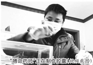
“搏命药师”正在制作胶囊(视频截图)

这样温馨搞笑的情节分别出现在晴雨天、大风天和酷暑天,聚焦在黑衣大叔帮助男主撩妹,但结尾回落都在“为您的幸福生活保驾护航”。在哈哈大笑的同时,你也会幡然醒悟,在你每一天的生活里,关心你、爱护你、时时刻刻不厌其烦的那个人,原来就是天气预报啊! 扬子