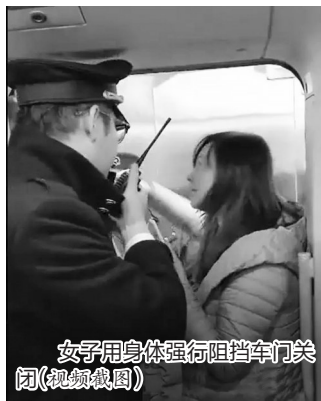
女子用身体强行阻挡车门关闭(视频截图)

8日,一个视频在网上引起了广泛关注。视频中,一女子带着孩子,以等迟到的老公为名,扒着高铁列车的门阻碍高铁发车,一车乘客都被耽误。该女子称:“我老公就在检票口了,让他上车。”综合