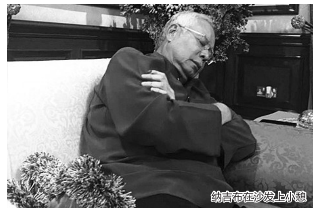
纳吉布在沙发上小憩

据路透社15日报道,马来西亚反贪委员会表示,早前已经掌握了纳吉布贪污的证据。报道称,反贪委员会掌握的证据显示,一马公司下属子公司曾在2015年底将一笔总额为4200万林吉特(约合6741万元人民币)的款项汇入纳吉布的银行账户。负责检讨反贪委员会调查工作的委员会成员林志伟(Lim Chee Wee)告诉路透社,总检察长阿班迪当时拒绝反贪委员会提出的进一步调查的建议。此外,反贪委员会也曾要求向外国寻求法律援助,追查一马公司亏空款项,但多次遭到阿班迪拒绝。报道也指出,这笔款项并非来自于纳吉布先前声称的捐赠者。 据澎湃新闻