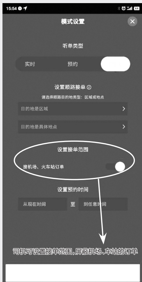
司机可设置接单范围,屏蔽机场、车站的订单