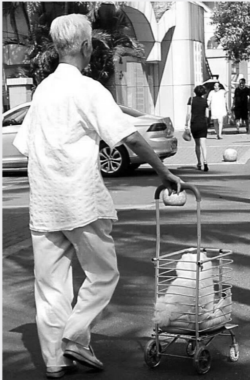
老人将狗狗放在小推车里