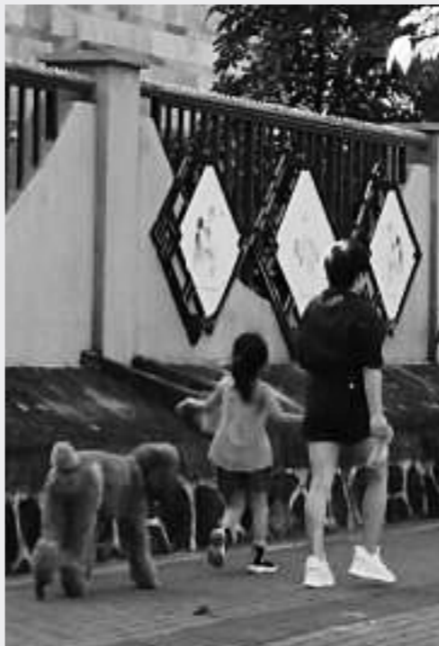
这只狗狗没拴绳子就上街