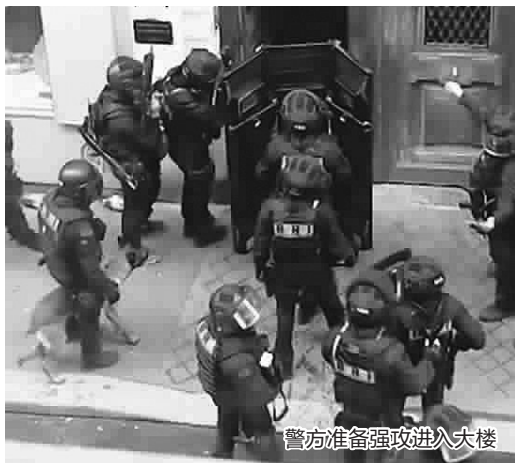
警方准备强攻进入大楼

法国首都巴黎12日发生劫持人质事件,嫌疑人被发动强攻的警方逮捕,两名人质安全获救。有关部门初步排除该事件涉及恐怖主义,作案原因或为精神失常。