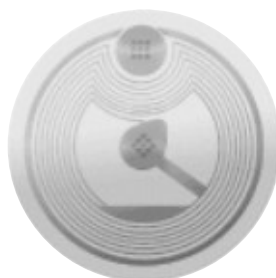
球内置芯片图

但本届世界杯将对旧规则做出较大改变,新规则为:即使比赛重新开始后,裁判在得知无球情况下的犯规后,也可以暂停比赛,回看这次犯规过程,并决定是否将球员罚下。如果裁判在中场休息时被告知上半场有球员犯规,他可以在中场时补发红牌。即使一个小时后球员的犯规才“现形”,裁判依然可以将他罚下。而这也意味着参加世界杯的球员一定要小心自己的动作,毕竟在众多摄像机的监视下,任何暴力动作都不会被摄像机忽略,暴力犯规的成本会变得非常大。