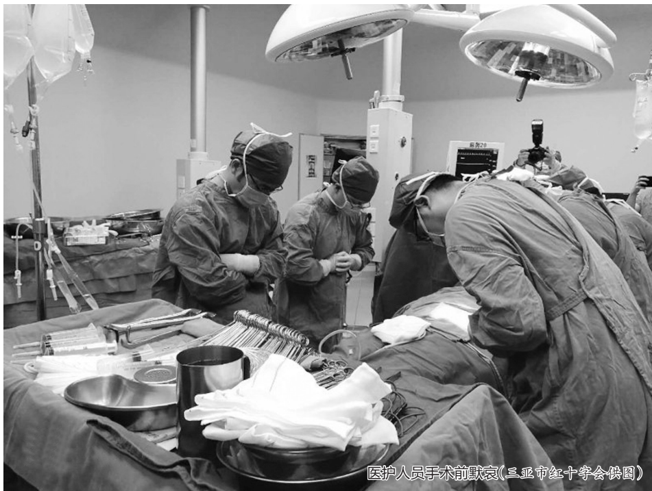
医护人员手术前默哀