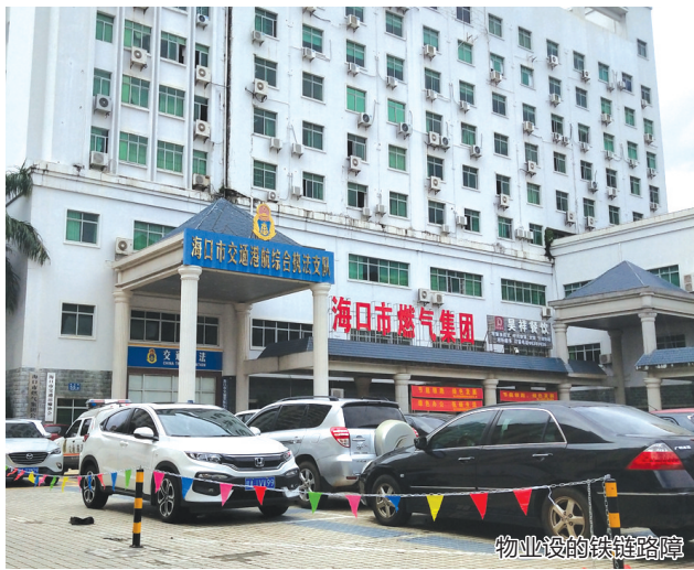
物业设的铁链路障