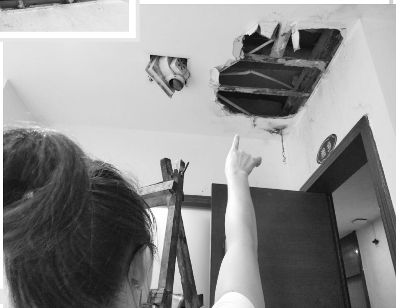
▶一楼包厢天花板被砸穿

本报讯 7月10日下午,海口龙华区金宇中路中一大厦8楼一业主装修时,砸了管道井外壁,没想到水泥砖块顺着管道井从8楼落到1楼,不仅砸坏2至5楼的管道,还砸穿一楼饭店包厢的天花板。饭店负责人阿文说,一个多星期过去了,天花板破洞仍未修补好。 记者 畅凯 文/图