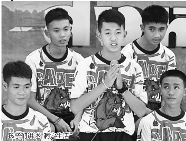
孩子们讲述“洞穴生活”

教练因为把孩子们带进洞中内疚,在洞中时曾传出纸条,向家长们道歉,得到原谅。这名25岁的年轻人说,发现出路被水淹没后,他带领队员寻找离水源较近处歇息。他同时让大家静坐以保存体力,等待救援人员到来。他们当时不知道,被困位置距离洞口有4公里。足球队员们分享了他们被困在洞穴中的生活细节。教练说,他们在洞中没有坐以待毙,他们每天坚持做的一件事情就是轮流挖洞。一名少年说,教练给同伴鼓励,告诉他们“坚持住,别绝望!”