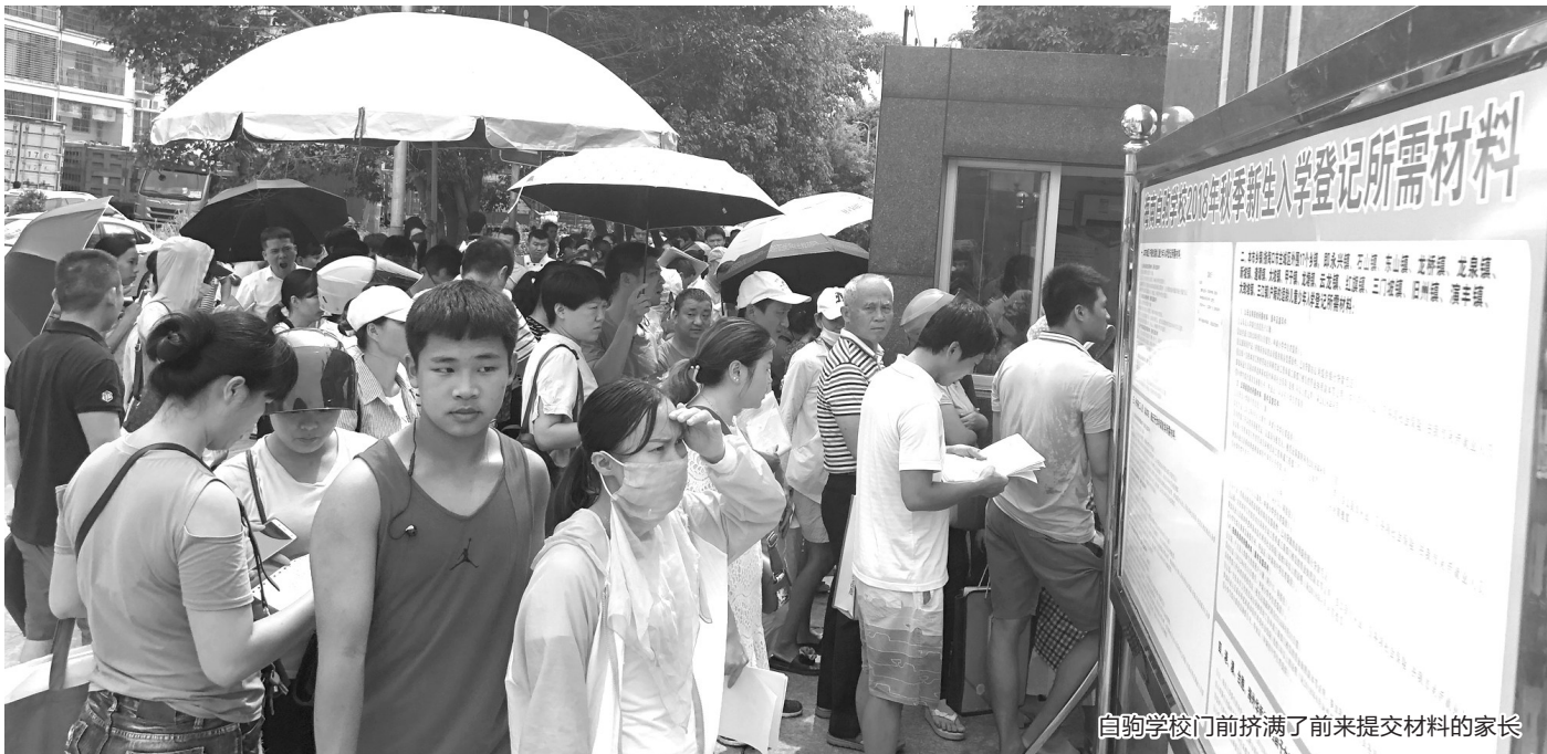
自驹学校门前挤满了前来提交材料的家长