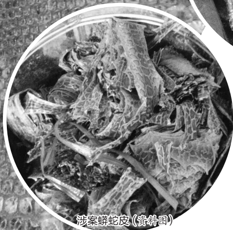
涉案蟒蛇皮(资料图)