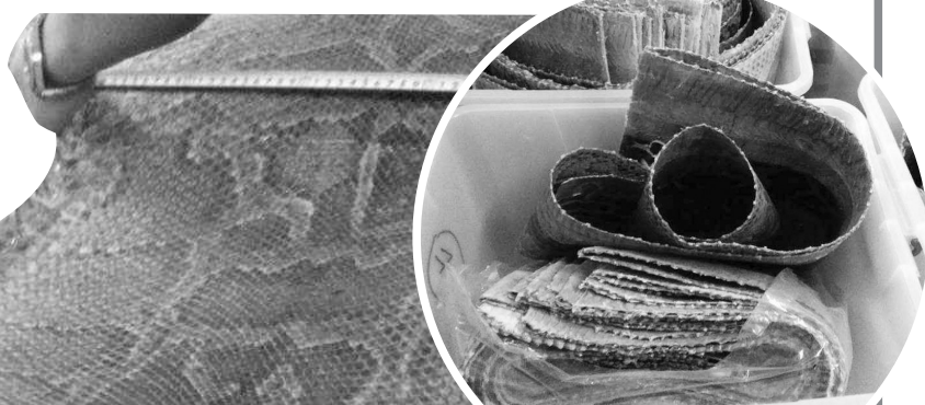
涉案蟒蛇皮数量较大(资料图)

“配电箱冒烟的原因现在还无法确定，我们在19时接到故障报告后就将10千伏红城湖线断电了。”海口市供电局的工作人员告诉记者，“虽然无法确定起火原因，但根据现场状况，我们已经和调度中心申请恢复供电，整个停电时间在40分钟左右。”该工作人员表示，他们将继续排查起火原因。