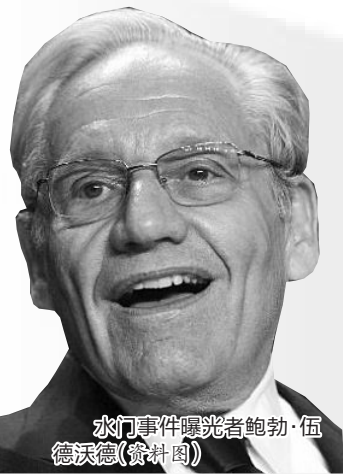
水门事件曝光者鲍勃·伍德沃德(资料图)