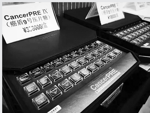
“癌盾”产品其实就是“糖”

132名,扣押涉案电脑156台、手机300余部,冻结银行卡500多张及资金7000余万元,查封假药仓库3个,扣押假药3000余箱,彻底摧毁了该犯罪集团。