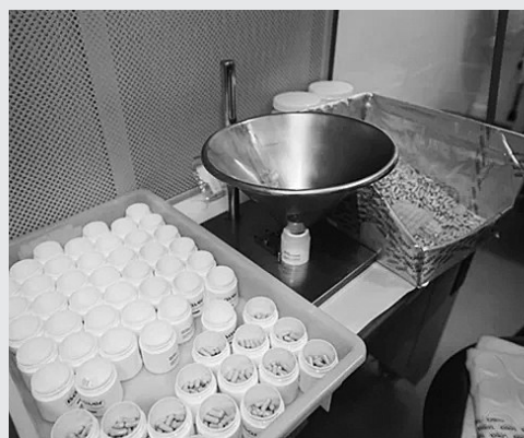
思兰德将产品灌装入自行设计的外包装盒内