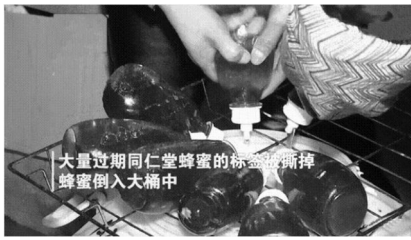
大量过期同仁堂蜂蜜的标签被撕掉 蜂蜜倒入大桶中