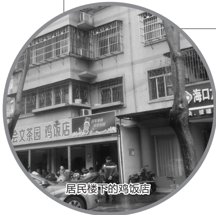
居民楼下的鸡饭店

本报讯 近日，记者走访海口部分小区发现，不少小区商铺“摇身一变”成了餐饮店，生活气息浓厚。“下个楼就能解决吃饭问题，节省时间和精力，挺方便的。”“居民楼开饭店油烟污染严重，客人进进出出又制造噪声，影响我们的生活作息”。对于商家在小区内开餐饮店一事，市民们有喜有忧。