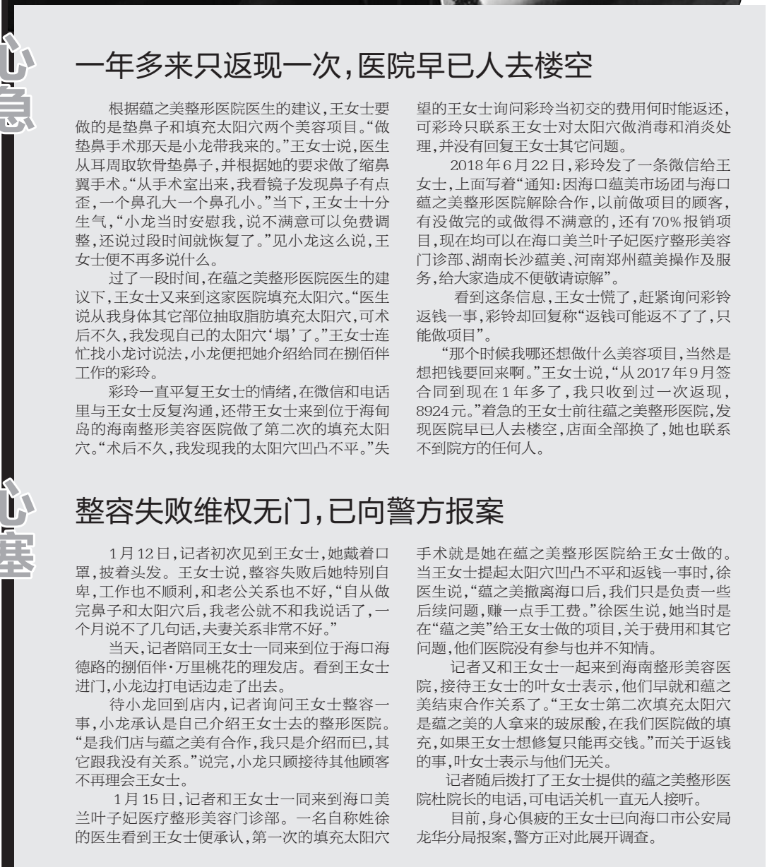
王女士出门都会戴口罩