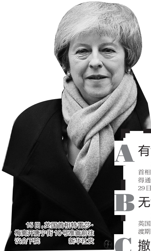
16日,英国首相特雷莎·梅离开唐宁街10号准备前往议会下院