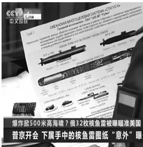
爆炸掀500米高海啸?俄32枚核鱼雷被曝瞄准美国 普京开会 下属手中的核鱼雷图纸“意外”曝