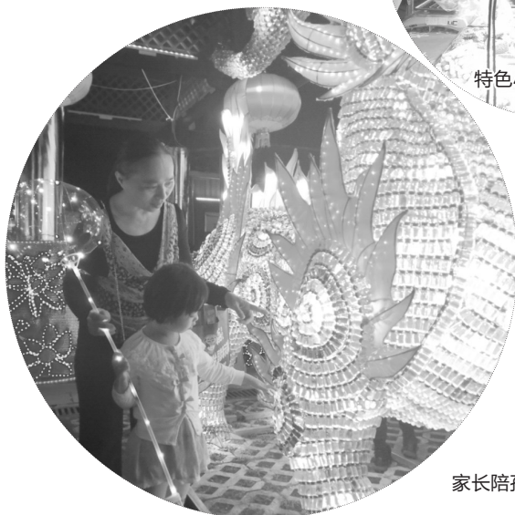
家长陪孩子看花灯