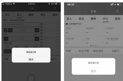
一些券商APP昨日早上宕机

一家中型券商资深经纪业务人士告诉记者，券商交易系统崩溃主要是因为行情来得太快，对于稳定性和容量考虑不足。券商的IT主要是物理集群，算力的分配数据依据不足，大券商或者对此比较重视的券商，会有一些富裕量，很多券商则投入不足。