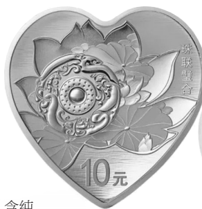
▲30克心形银质纪念币背面

30克圆形银质纪念币为精制币(2枚),含纯银30克,面额10元,成色99.9%,最大发行量2×20000枚。中新