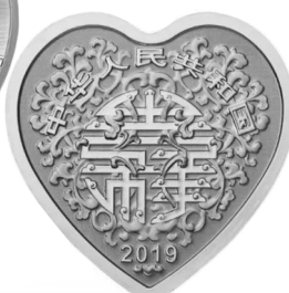
▲3克心形金质纪念币背面