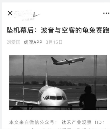
坠机幕后:波音与空客的龟兔赛跑