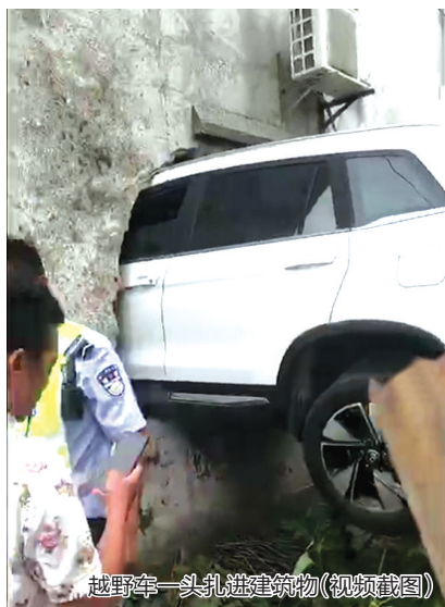
越野车一头扎进建筑物(视频截图)

本报讯 5月14日,网络流传一则短视频,一辆白色越野车“破墙入室”,车头钻进民房内。有网友称事发海口市灵山镇,同时指出并无人员伤亡,质疑似是“女司机”所为。记者联系海口市交警支队,经警方核实后发现,海口市灵山镇并无相关警情,确认网络传播情况为不实消息。 记者 畅凯