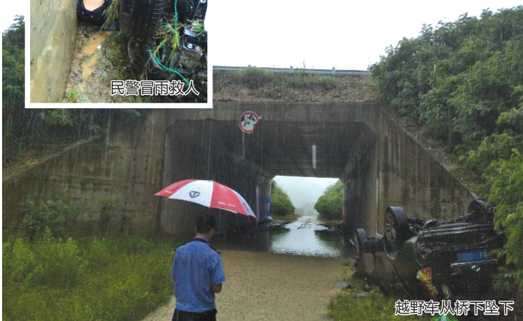
越野车从桥下坠下