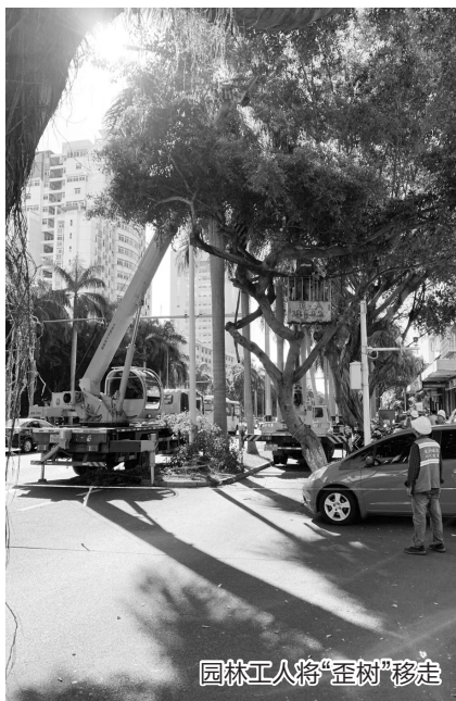
园林工人将“歪树”移走