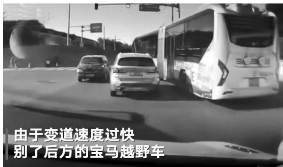
由于变道速度过快 别了后方的宝马越野车