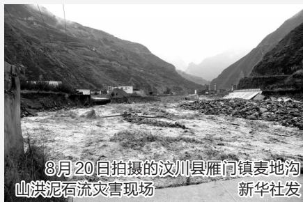
8月20日拍摄的汶川县雁门镇麦地沟山洪泥石流灾害现场

受强降雨影响,20日凌晨2时许,四川省阿坝州汶川县多处发生泥石流,其中三江镇、水磨镇、银杏乡等地灾情较重,境内电力、通信暂时中断,目前汶川县至成都、理县方向道路均已中断。