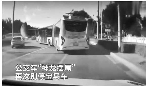
公交车“神龙摆尾” 再次别停宝马车