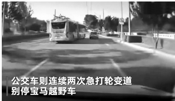
公交车则连续两次急打轮变道 别停宝马越野车