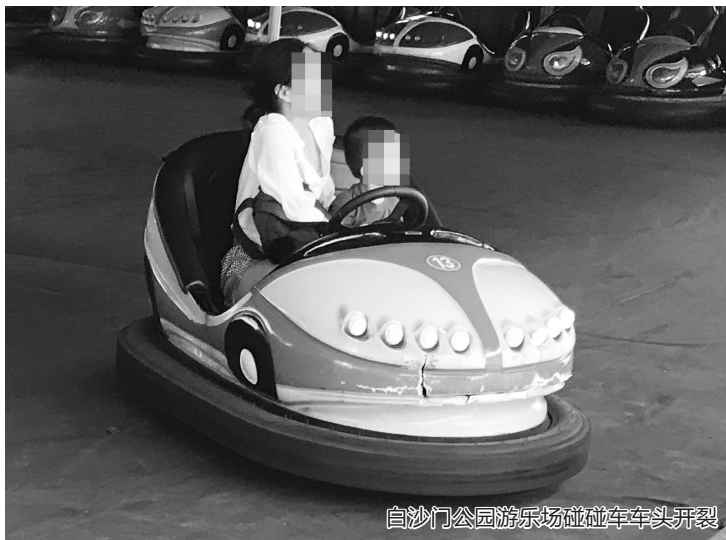
白沙门公园游乐场碰碰车车头开裂