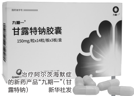
治疗阿尔茨海默症的新药产品“九期一”(甘露特钠)