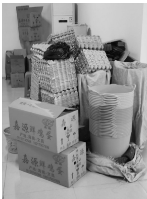
王阿婆领回来的免费礼品