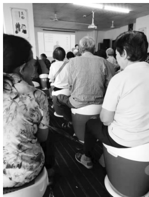
艾灸馆里坐满了听讲座的老人

本报讯 艾灸馆免费艾灸、送水送鸡蛋，心动吗？海口居民黄秀英最近很苦恼，年过六旬的母亲迷上了艾灸，每天都去艾灸馆听讲座，刚开始的时候经常带回来免费的鸡蛋、塑料盆、塑料筐、还有塑料刷子等小物件。母亲听了一段时间讲座之后，就开始跟家人要钱买保健品，还扬言“不给钱买保健品就喝老鼠药自杀。”半年时间，在该艾灸馆买了2万元保健品。最让黄秀英担心的是，母亲自从听了讲座吃了保健品，连每天必须吃的药都停了，改吃保健品。这究竟是怎么回事，近日，记者进行了走访调查。（受访者要求，文中人物全为化名。） 记者 畅凯 文/图