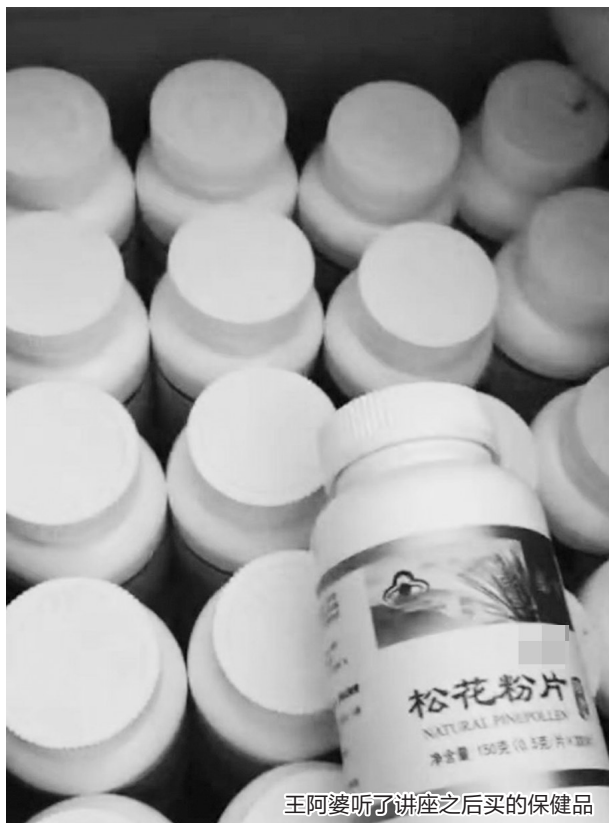
王阿婆听了讲座之后买的保健品