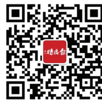
海南特区报微信公众号