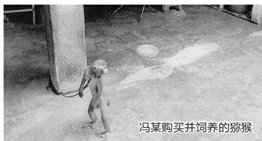
冯某购买并饲养的猕猴