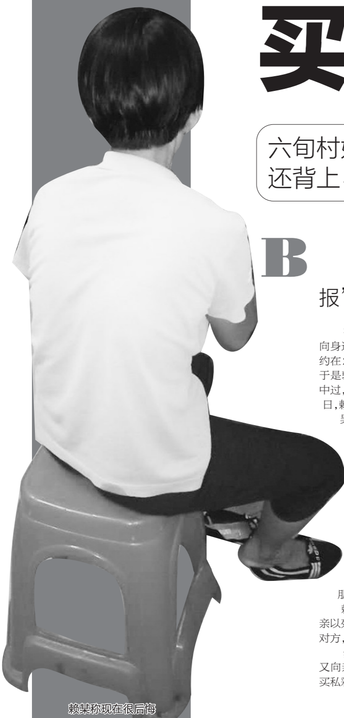
赖某称现在很后悔