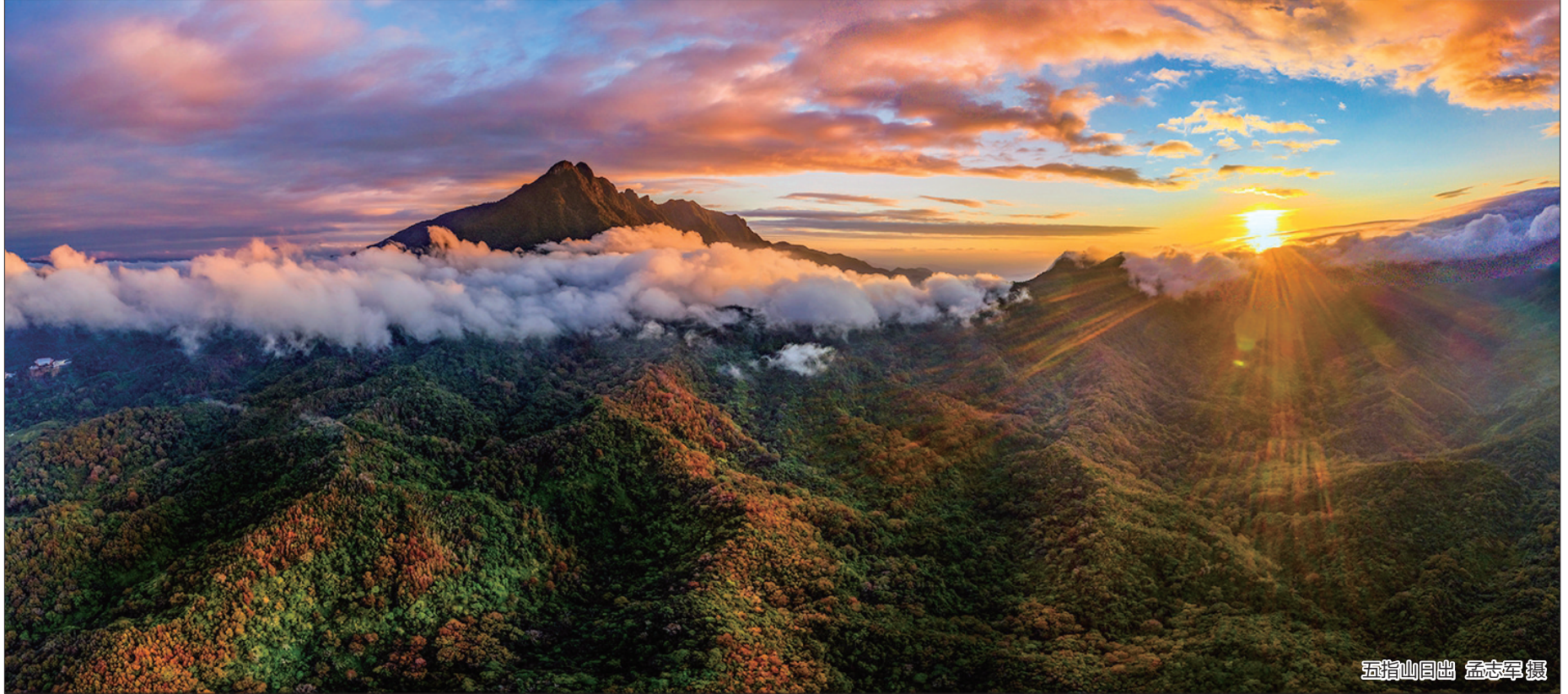
五指山日出