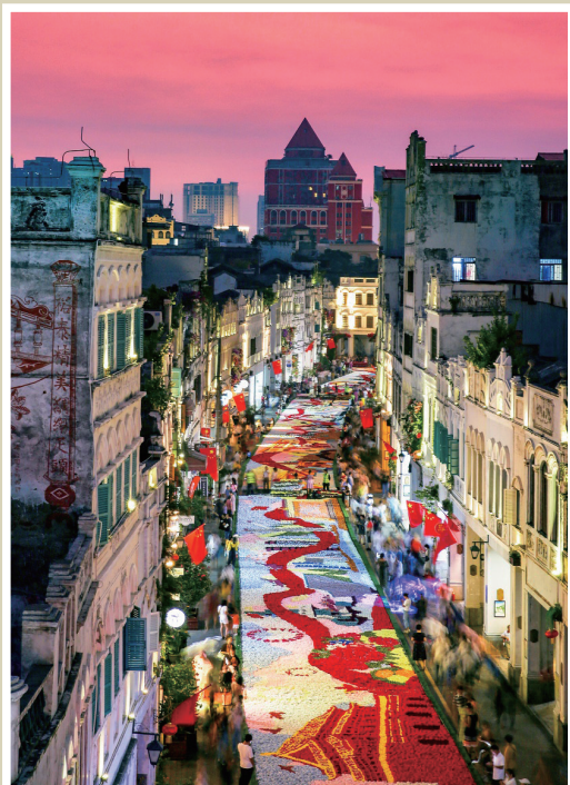
海口骑楼