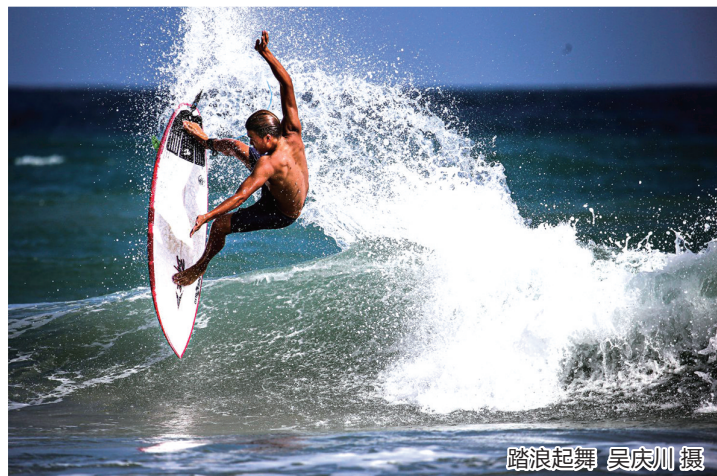
踏浪起舞

记者从大赛组委会获悉,本次大赛一共征集到近4000幅摄影作品,经组委会及专家初步评选,筛选出150幅优秀入围摄影作品。9月4日-9月13日正式开启网络评选投票系统。近日,大赛组委会组织开展第二轮专家评选,最终评选出5大奖项60幅优秀摄影作品。据悉,获奖作品名单公示时间为9月17日-20日,咨询电话:66725877。 记者 钟起的